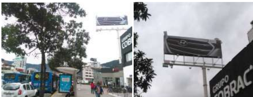
VALLA INSTALADA ANUNCIA SENTIDO OESTE - ESTE: HYUNDAI